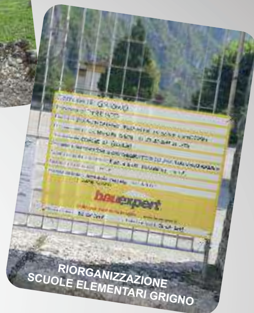
RIORGANIZZAZIONE SCUOLE ELEMENTARI GRIGNO