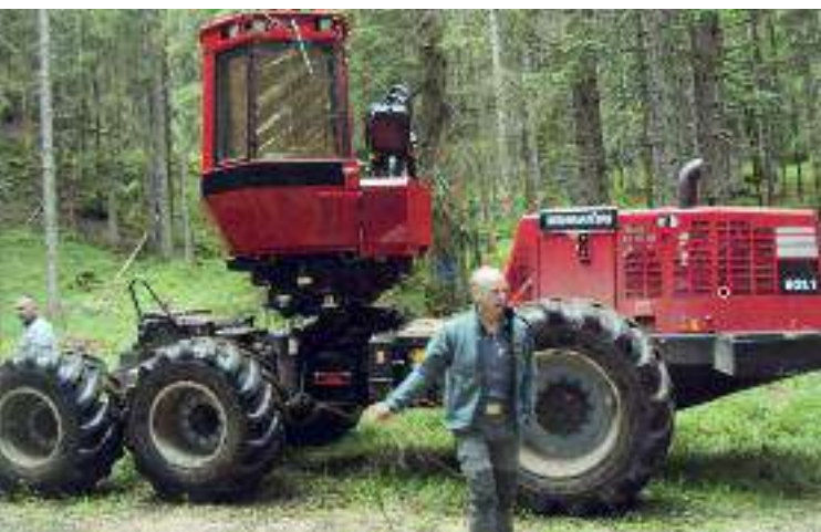
Il nuovo processore forestale Harvester

Anche qui a valle, specialmente vicino ad abitazioni e strade abbiamo situazioni di piante ad