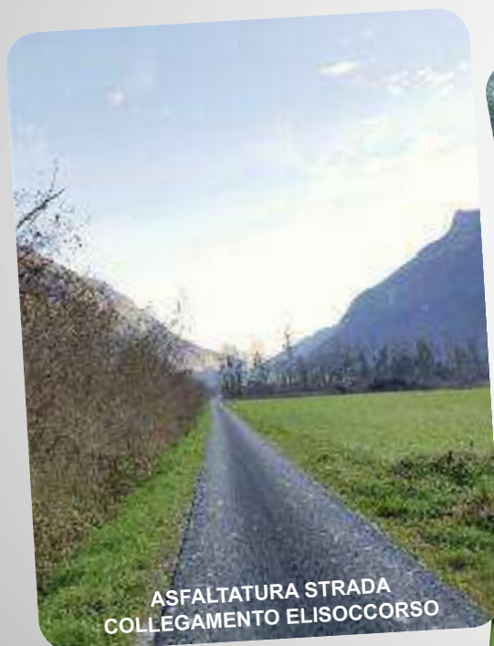
ASFALTATURA STRADA COLLEGAMENTO ELISOCCORSO