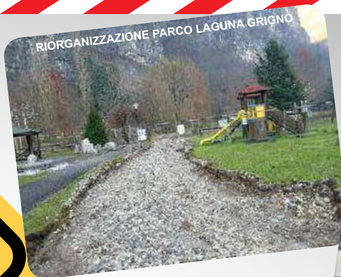
RIORGANIZZAZIONE PARCO LAGUNA GRIGNO