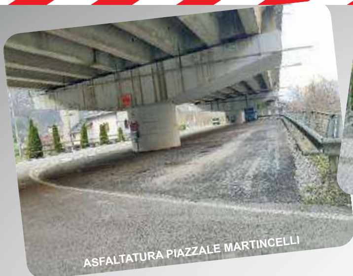
ASFALTATURA PIAZZALE MARTINCELLI