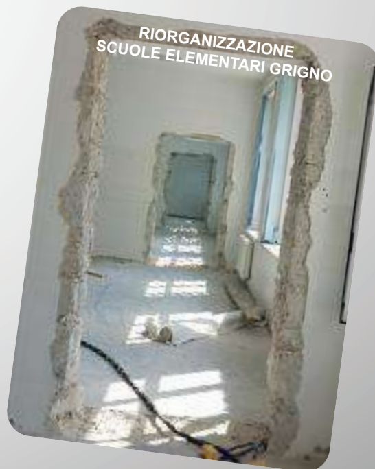
RIORGANIZZAZIONE SCUOLE ELEMENTARI GRIGNO

Autorizzazione Tribunale Trento n. 497 del 12/07/1986