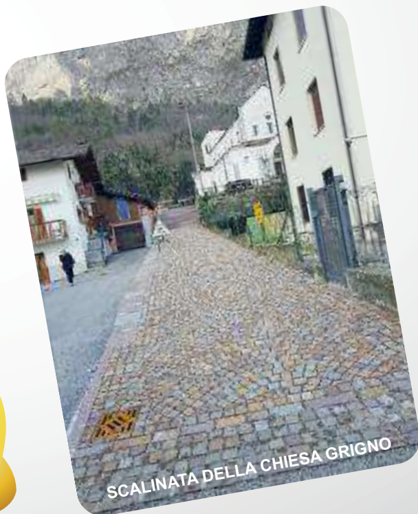
SCALINATA DELLA CHIESA GRIGNO