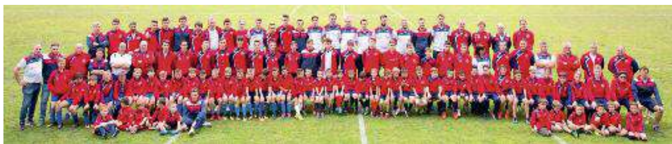
Foto società 2018