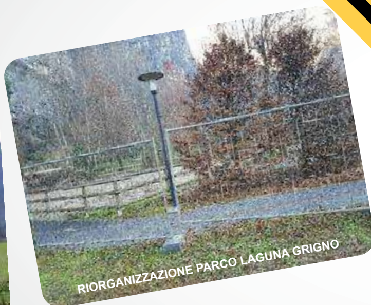
RIORGANIZZAZIONE PARCO LAGUNA GRIGNO