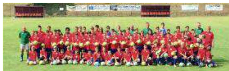
Foto dei partecipanti del camp estivo svoltosi nella prima settimana di luglio

Prosegue anche un'intensa attività extra-sportiva