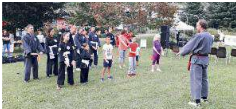
Presenza alla Festa del Volontariato a Borgo Valsugana

Anche quest'anno presso la palestra delle scuole medie di Grigno sono iniziati i corsi di Qwan ki do, di ginnastica dolce - tam the in collaborazione con il Gruppo Donne di Grigno - Tezze (sempre presente a dare una mano) e di presciistica. Il corso di Qwan ki do è per bambini dai 5 ai 13 anni senza distinzione di sesso, età o razza. Il corso di ginnastica dolce è mirato per le donne che vogliono fare un po' di movimento, stare in compagnia senza "sudare 7 camicie". Il corso di presciistica è per uomini e donne che vogliono fare un allenamento medio - intenso o per chi vuole tenersi in forma o prepararsi per la stagione invernale. Quest'anno abbiamo inserito anche un corso di Difesa Personale dedicato alle donne della durata di un'ora una volta a settimana. Gli appuntamenti per i bambini del corso di Qwan ki do per l'anno: la festa del bambino, lo stage con il maestro fondatore Tong, gare e gite varie. Inoltre in primavera il centro QKD Tang Lang proporrà ai loro piccoli atleti, per il quarto anno consecutivo, "la notte del Dragone". I piccoli guerrieri dormiranno in palestra dopo aver fatto allenamento e cena tutti insieme. Ma