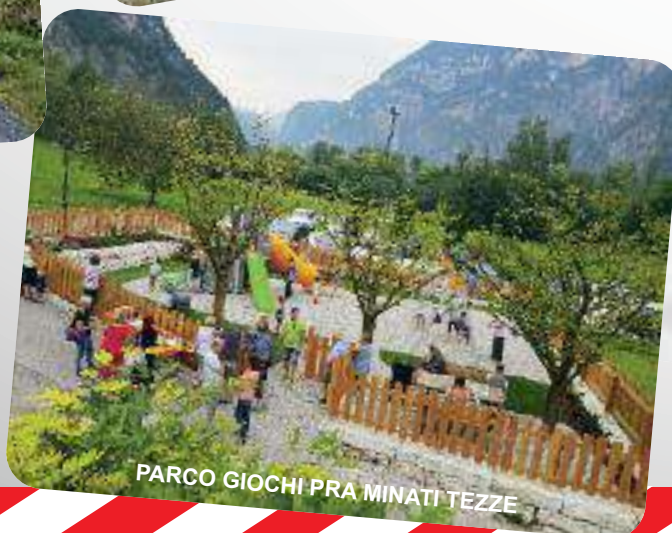
PARCO GIOCHI PRA MINATI TEZZE