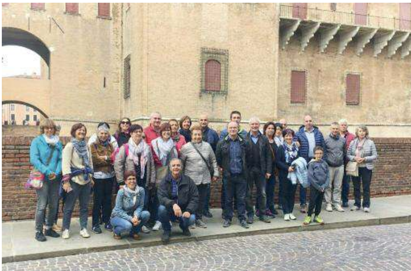
Gita a Ferrara

A tutti un arrivederci al 29 dicembre con il giro "Drioghe ala Stela" nelle frazioni.