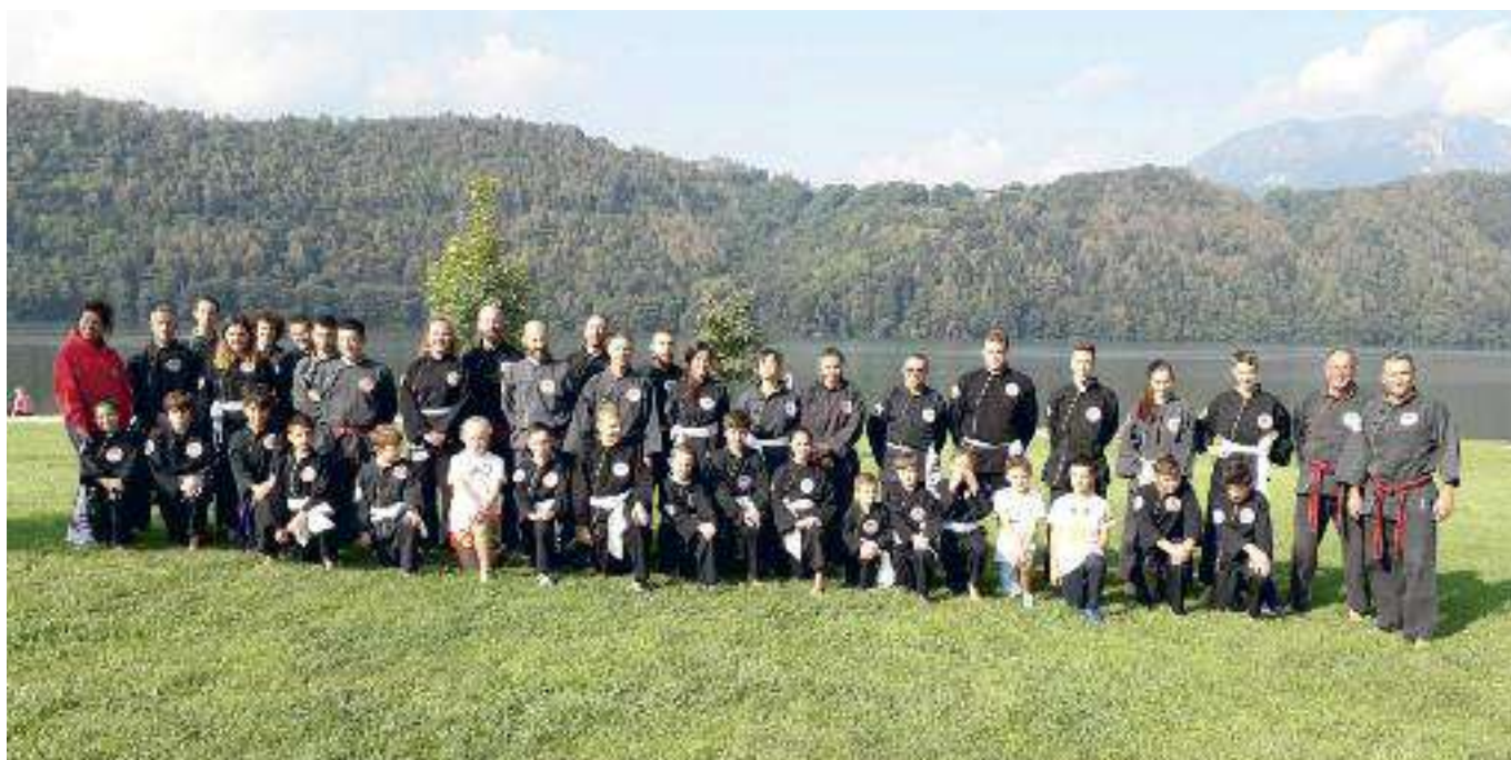
Presenza all'Alzheimer Fest a Levico Terme