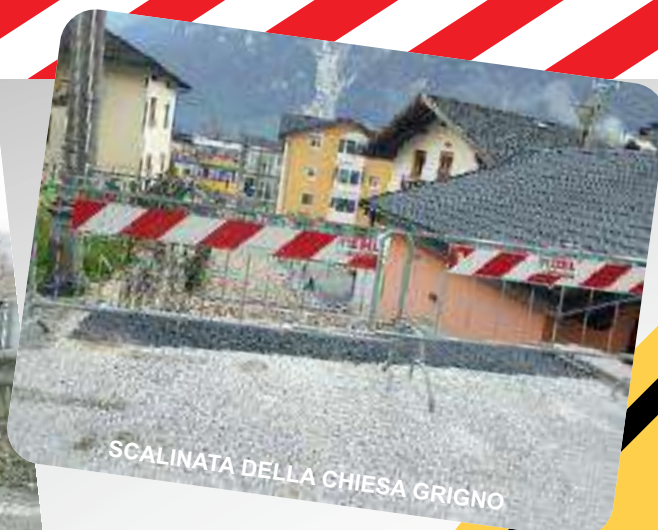
SCALINATA DELLA CHIESA GRIGNO