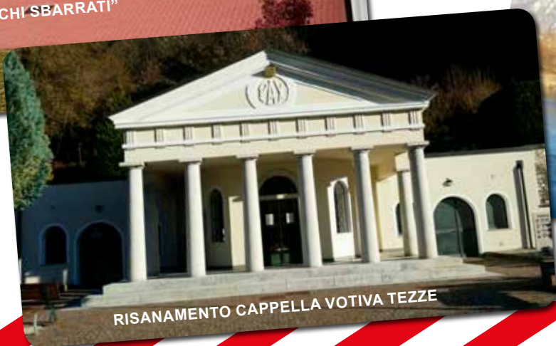
RISANAMENTO CAPPELLA VOTIVA TEZZE