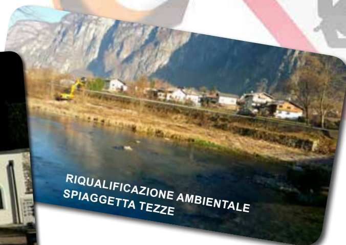
RIQUALIFICAZIONE AMBIENTALE SPIAGGETTA TEZZE