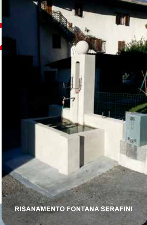
RISANAMENTO FONTANA SERAFINI