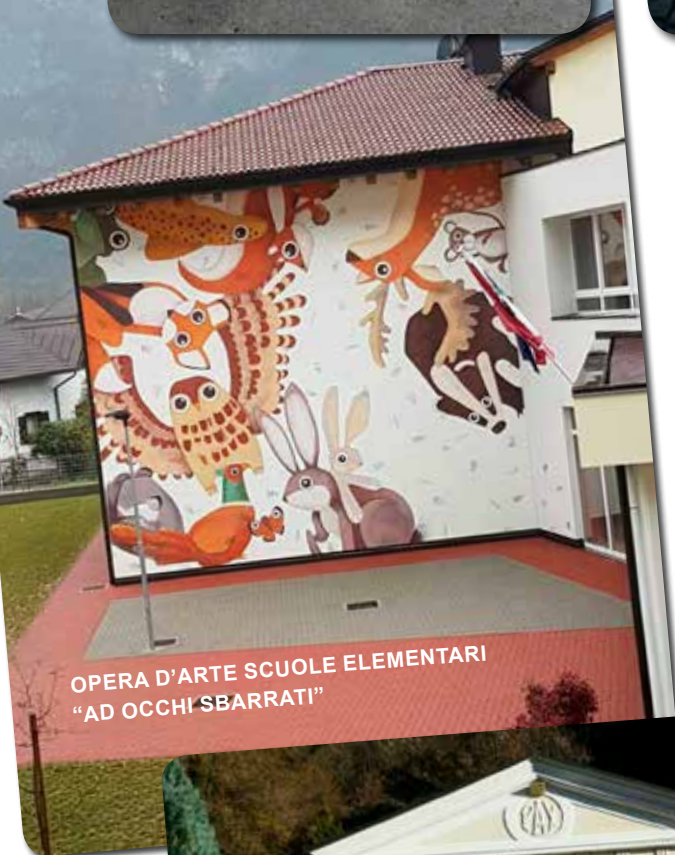
OPERA D'ARTE SCUOLE ELEMENTARI "AD OCCHI SBARRATI"