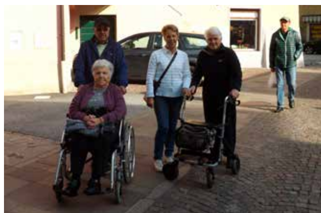
Ospiti e volontari in passeggiata per Grigno

Per concludere, auguriamo a tutta la comunità un felice Natale e un Nuovo Anno di pace e serenità.