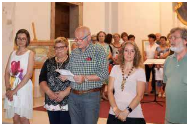
Inaugurazione mostra degli Artisti Altopianesi con il coro Parrocchiale di San Giacomo.