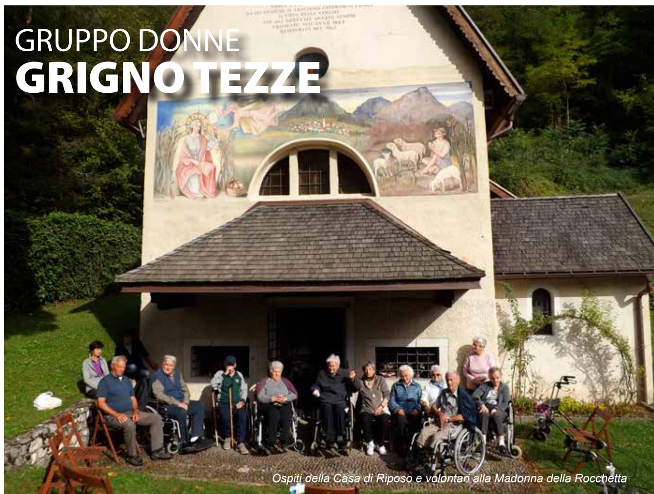
Ospiti della Casa di Riposo e volontari alla Madonna della Rocchetta

Le attività del gruppo per il 2017-2018 sono iniziate a settembre con i corsi di yoga, ginnastica dolce e mini volley. A novembre è partito il progetto "Un cane per amico", attività che si svolge all'interno della Casa di Soggiorno di Grigno. È un progetto di animazione che tende a sollecitare l'emotività, l'affettività dell'anziano attraverso la relazione con il cane proponendo giochi semplici in cui il soggetto si sente coinvolto direttamente. Ringraziamo il Presidente, il Direttore e tutto il personale della Casa di Soggiorno per la disponibilità dimostrata nell'accogliere la nostra proposta.