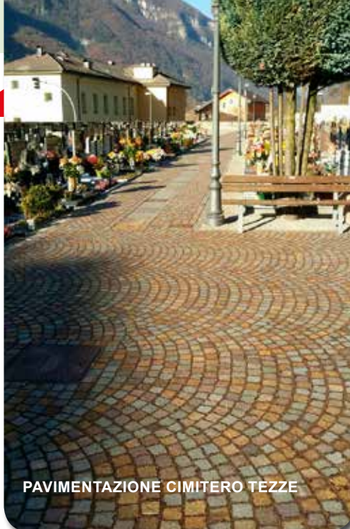
PAVIMENTAZIONE CIMITERO TEZZE