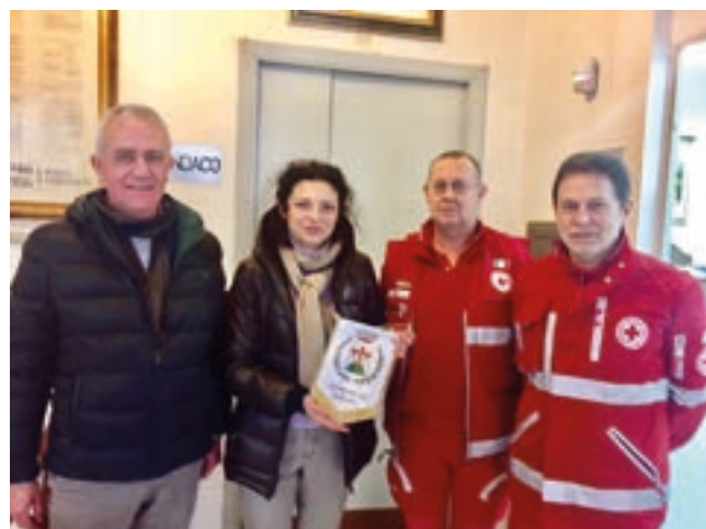
La sindaca di Serrapetrona con i volontari