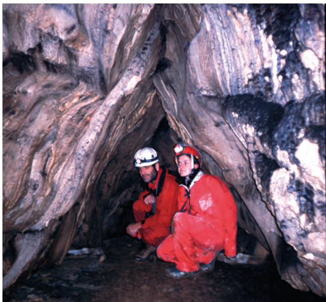
Bus dela Bela 2003, arch. GG Selva