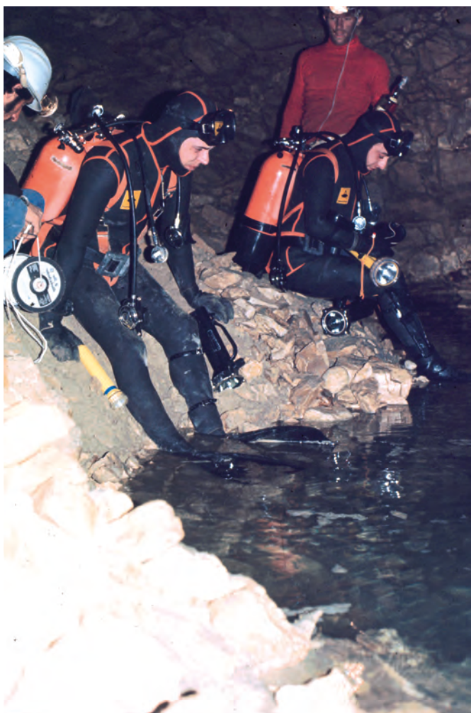
Grotta dell'Acqua Nera 1972, arch. GG Selva

infine nei loro antri quando i sub trionfanti uscirono dal sifone. Erano passati!