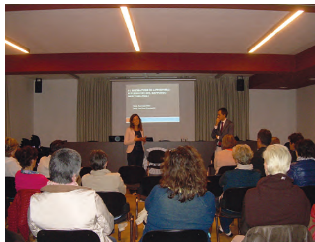
Incontro con i genitori

Per concludere l'associazione desidera ringraziare per la collaborazione alle nostre attività il Comune, la Cassa Rurale Valsugana e Tesino, le Pro Loco di Grigno e Tezze, i Circoli Pensionati e il Gruppo Giovani. Auguriamo a tutta la comunità un felice Natale e un 2015 di pace e serenità.