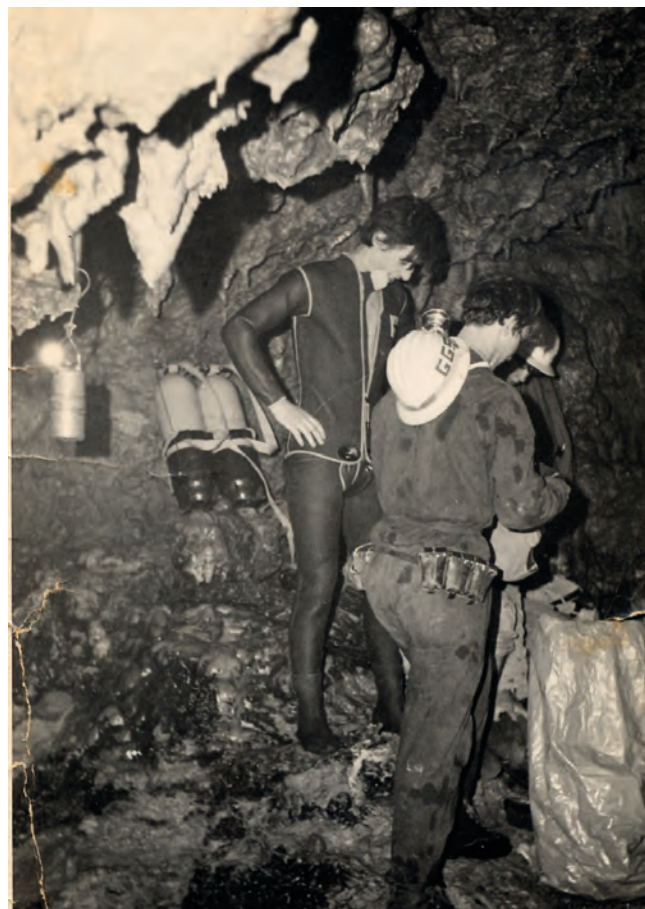
Grotta Castel Tesino 1971, arch. GG Selva

La primavera era dilagata solo nelle pianure quella volta che in tre entusiasti partimmo da Borgo in autostop con tutto l'armamentario sulla schiena per raggiungere gli altri alla Grotta di Castello. Fu certo un miracolo, però trovammo un passaggio fino a Castello e addirittura ai Magri. Ma lassù di primavera non c'era neanche l'ombra e scendemmo alla grot-