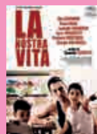
5) La nostra vita [con] Elio Germano ... [et al.]; un film di Daniele Luchetti