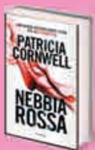
1) Cornwell, Patricia Daniels. Nebbia rossa