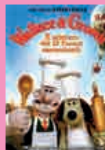
4) Wallace & Gromit: Il mistero dei 12 fornai assassinati.