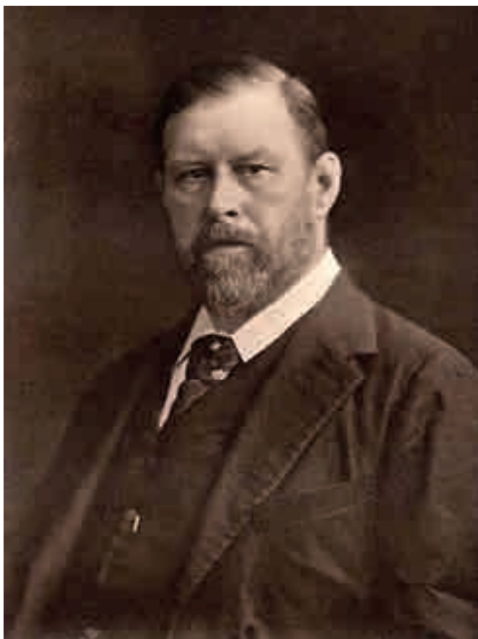
Abraham "Bram" Stoker 8 Novembre 1847 – 20 Aprile 1912

Quest'anno si celebra il centenario della morte di Bram Stoker (1847-1912), il padre di Dracula (Clontarf, Dublino 1847 – Londra 1912).