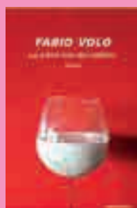
3) Volo Fabio Le prime luci del mattino