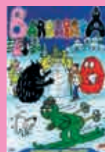
5) Barbapapà sulla neve