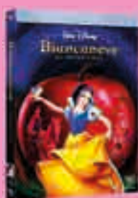
1) Biancaneve e i sette nani