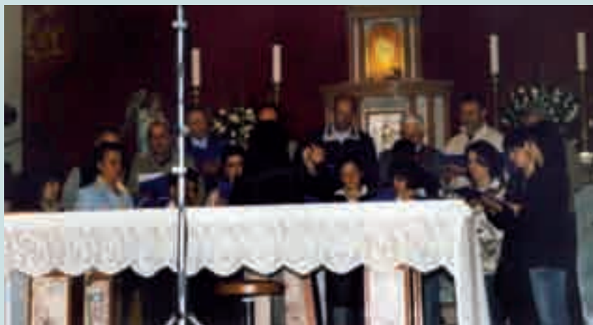
Il CORO di TEZZE alla Rassegna dei Cori Parrocchiali