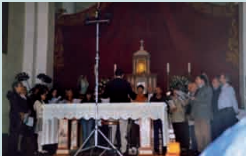
Il CORO di GRIGNO alla Rassegna dei Cori Parrocchiali