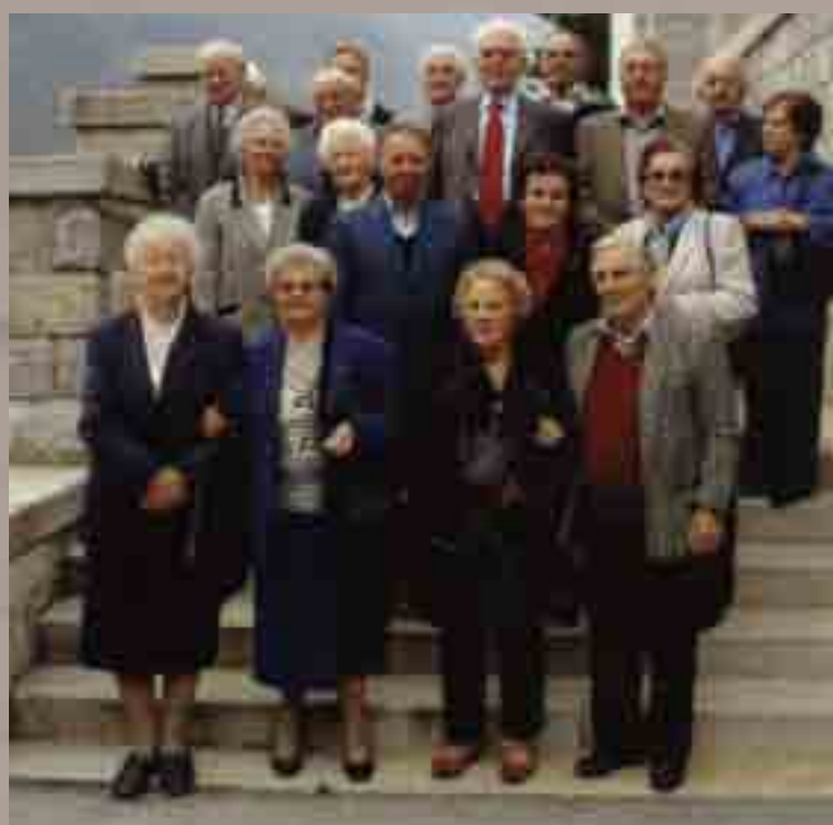
La Classe del 1928 ha festeggiato i suoi 80 anni con una S. Messa a Grigno seguita dal pranzo presso la Conca d'Oro